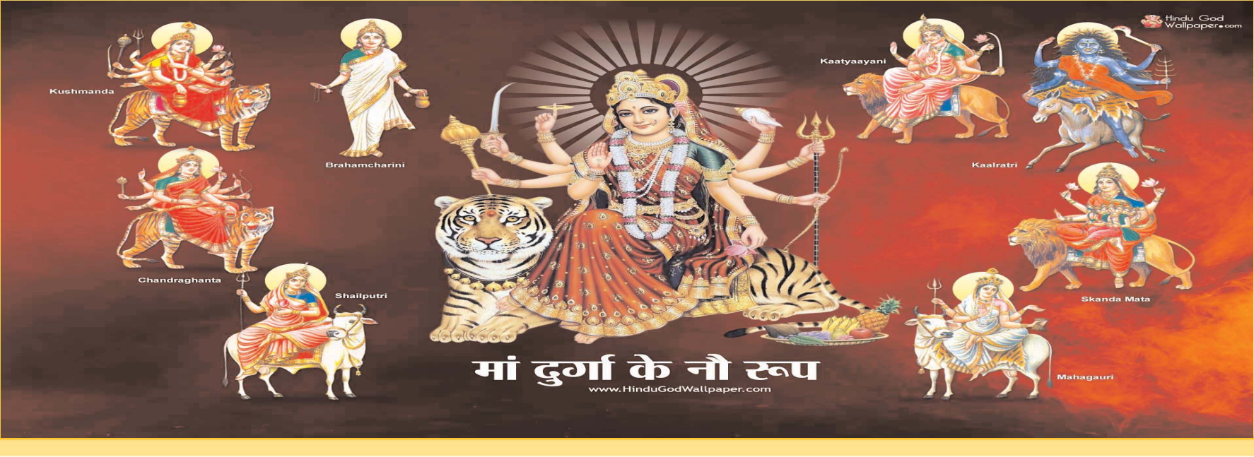
माँ दुर्गा के नौ रूप