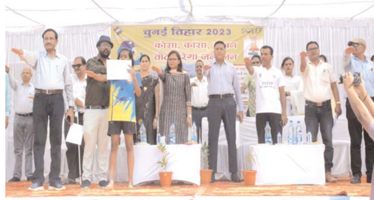
संत शिरोमणि गुरु घासीदास महाविद्यालय पामगढ़ ज्ञान ज्योति उच्च. माध्य. विद्यालय