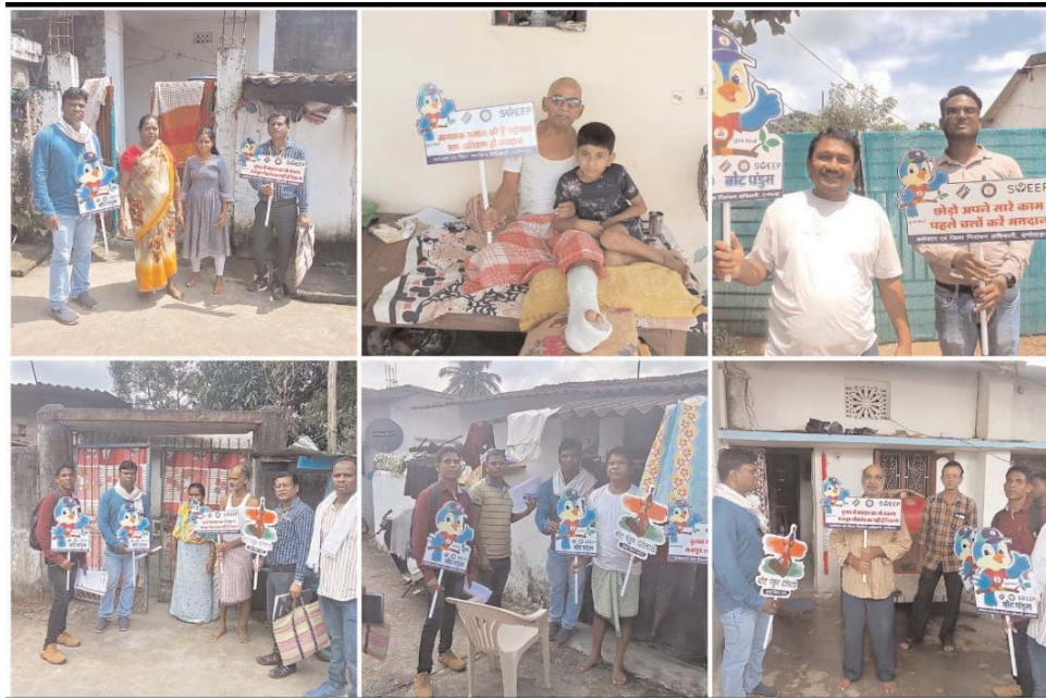
नाम जुड़वाए जाने हेतु जागरूक करने, मतदाता सूची विसंगतियों से बृथ लेवल अधिकारी को अवगत कराने, और संबंधित मतदाता को निर्धारित फॉर्म