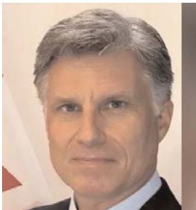
कौन था आतंकी हरदीप सिंह निज्जर?